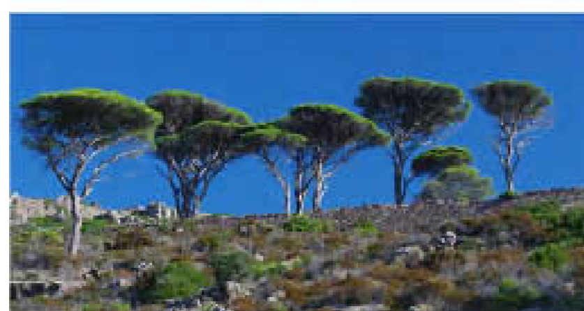
STUDIO DI FATTIBILITÀ